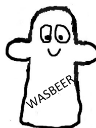
Handpop 2 NAAM: WASBEER