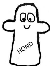
Handpop 1 NAAM: BOBBIE