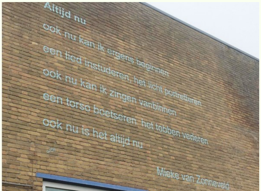
Gedicht op gevel bij Viore, Centrum voor mensen die leven met kanker.

Een groot aantal gedichten in openbare ruimtes in Nederland en België zijn verzameld op de website 'straatpoëzie' . Ze zijn te lezen op muren, gevels, daken, plakaten, standbeelden, borden, posters, schuttingen of stoeptegels.