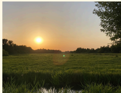
Coverfoto - Zonsondergang bij De Oude School in Kortenhoef