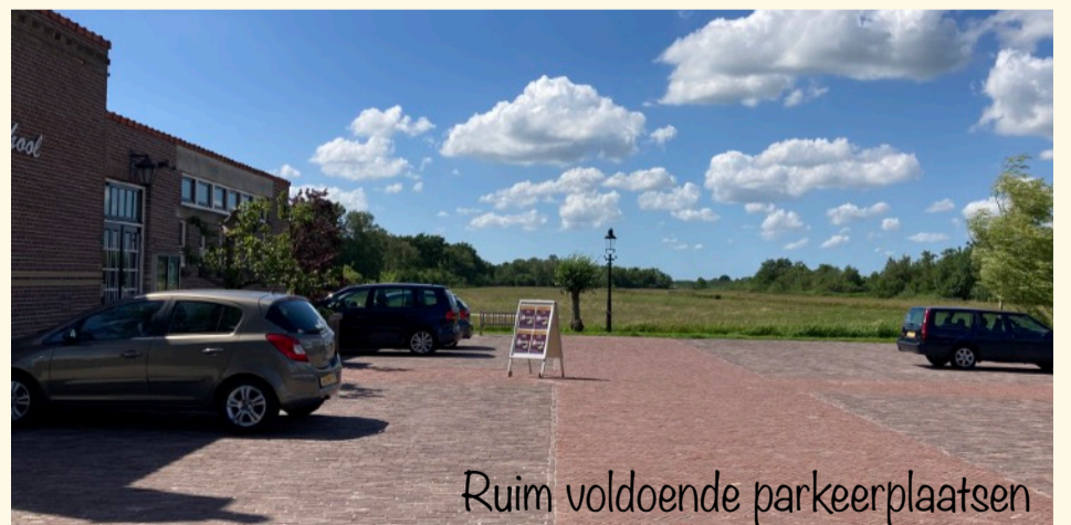
Ruim voldoende parkeerplaatsen

Op de website kun je meer lezen over de Schrijfcafé's op de drie locaties.