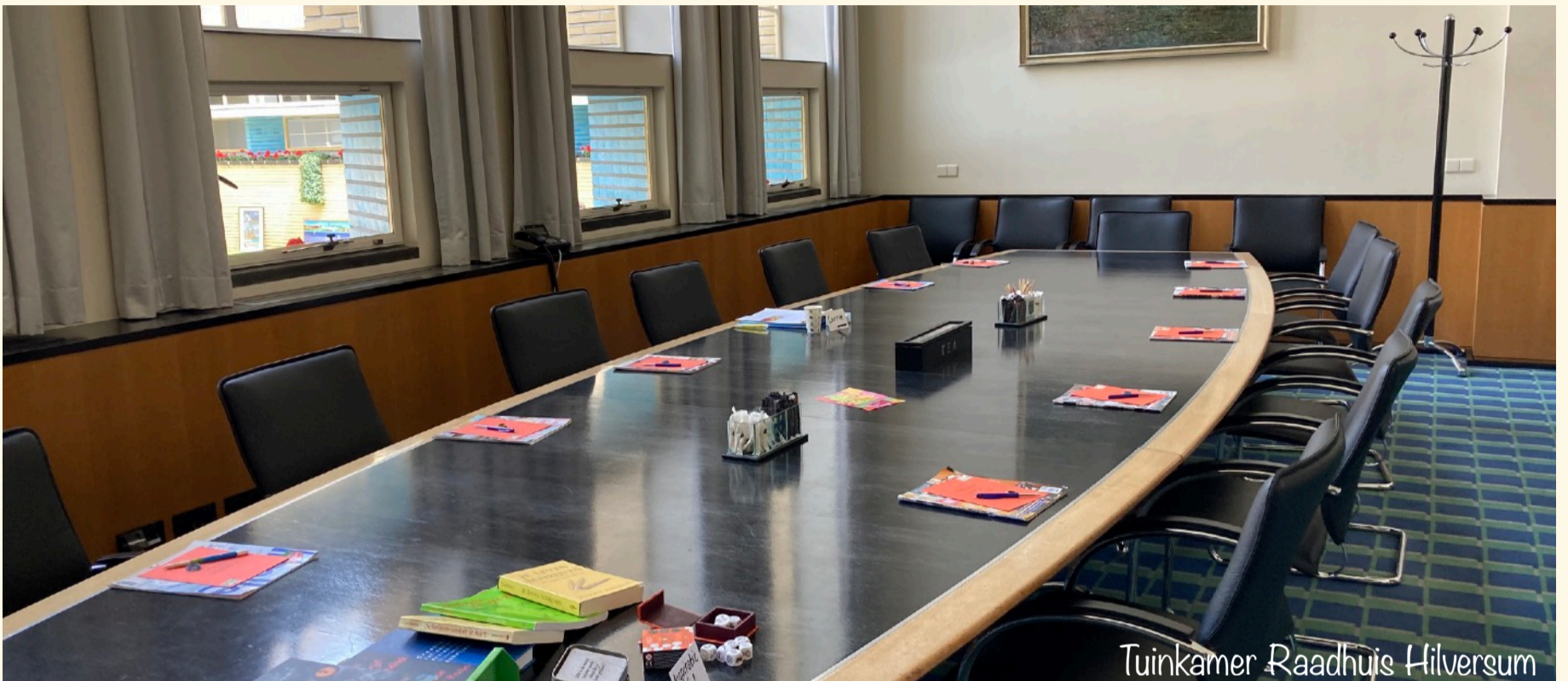
Tuinkamer Raadhuis Hilversum