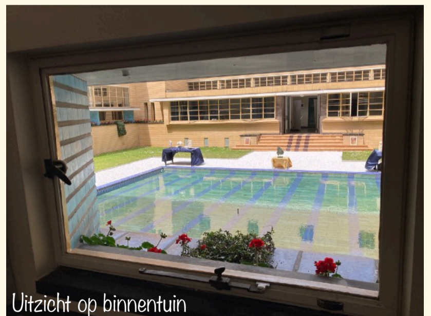
Uitzicht op binnentuin

Het was ondanks de hitte bedrijvig in het Raadhuis. Alles lag klaar om tijdens twee sessies Schrijfcafé tien mensen te ontvangen in de Tuinkamer. Er kwam...niemand. Is schrijven niet hip genoeg of was het te heet? Kwam het door het ontbreken van het programmaboekje, de doodlopende gang, de geblokkeerde deur? Desondanks heb ik genoten; van de prachtige ambiance, kon zelf alles bekijken en uitrusten van het Schrijfcafé Hilversum die ochtend met gelukkig wel een aantal deelnemers. Volgend jaar ben ik weer van de partij, maar dan pak ik het anders aan. Een uitdaging!