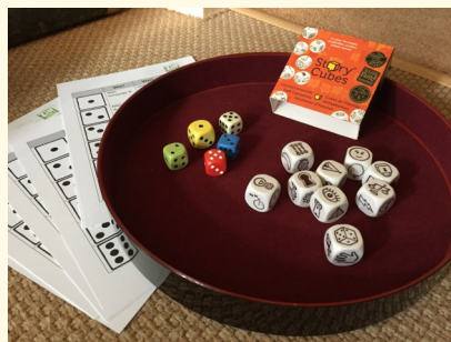
Coverfoto: 'Dobbelen en schrijven' in het Schrijfcafé