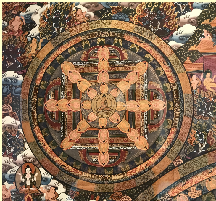
Eén van de zeven cirkels van de mandala.

figuurtjes die het leven van Boeddha, de Indische prins Gautama, uitbeelden. Naar de zeven cirkels, één grote in het midden en symmetrisch er drie onder en boven. Naar de rand met draakjes en demonen. Ongelooflijk fijn en minutieus geschilderd. Het is bijzonder om ze elke keer opnieuw en steeds anders te zien. Een ontdekkingsreis, altijd weer. De mooie Mandala uit Nepal.