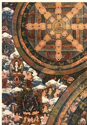
Het verhaal achter de foto op de cover lees je in het 'Podium'