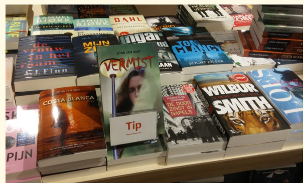
'Vermist' als tip bij de Bruna

Met wijd geopende ogen staarde ze nu recht voor zich uit en hield van ontzetting haar hand voor haar mond. Met een enorme ruk gooide ze het kussen van haar schoot, dat rakelings langs de lampetkan vloog die op het dressoir stond. De tranen liepen over haar wangen, want ze wist weer waar zich dit allemaal afspeelde. Het was thuis, bij haar ouders, en ze heette geen Marianne, maar Joke. 'Ik ben Joke!!', schreeuwde ze uit. Het was haar herinnering aan haar beste vriendinnetje, die na het spelen met die besmette spuit overleed op 29 juni 1973.