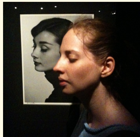
some resemblance...

Schrijf een tekst van maximaal 300 woorden waarin je ingaat op de vraag in hoeverre je op je ouder(s) lijkt en wat dit voor jou betekent.