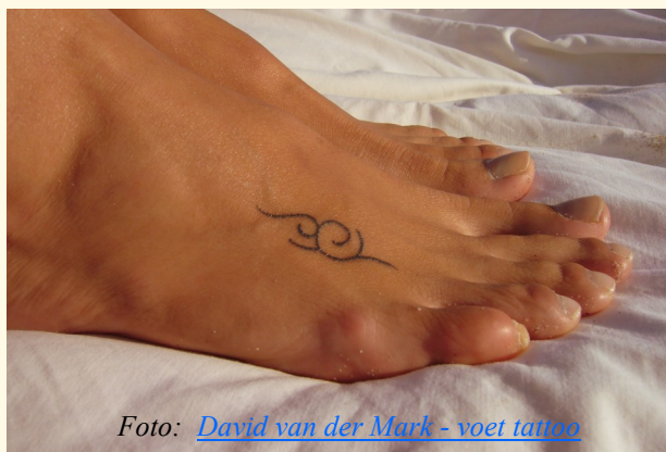
voet tattoo

Maak voor jezelf een lijstje van herinneringen die aan je huid af te lezen zijn. Kies er eentje waarvan je het verhaal erachter in een tekst van maximaal 300 woorden vertelt.