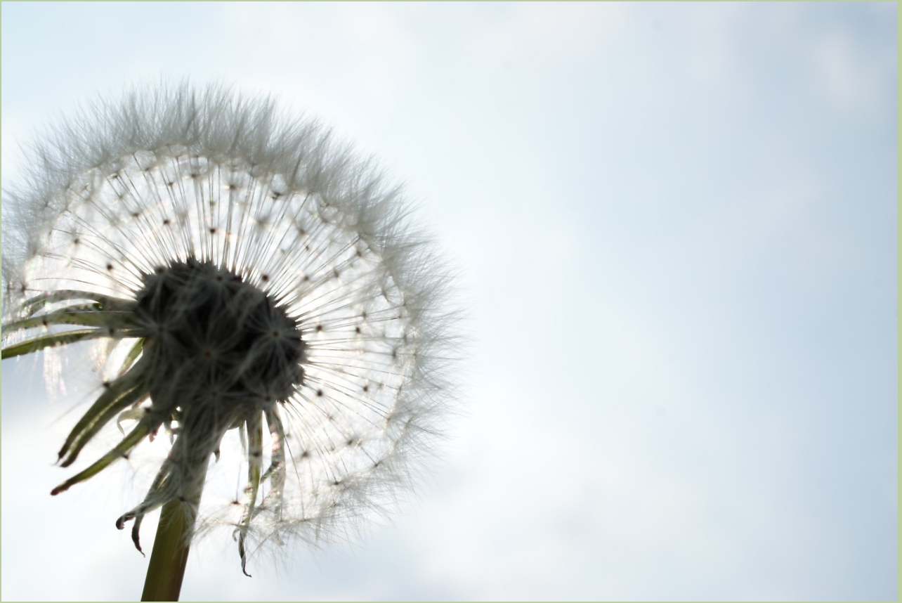
Paardebloem

Licht ik wil lichtheid constant hoe weet ik nog niet totale lichtheid veroorzaakt zweverigheid halve lichtheid is al voldoende een evenwicht, dat is het mooiste ik ga het proberen, dagelijks